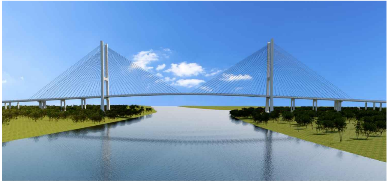
Puente Internacional de la Bioceánica CARMELO PERALTA . ALTO PARAGUAY – Republica del Paraguay PORTO MURTINHO – MATO GROSSO DO SUL – República Federativa del Brasil